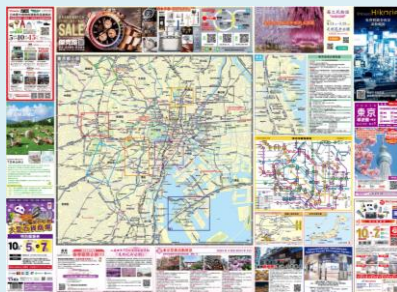
< 誌面 表面 >