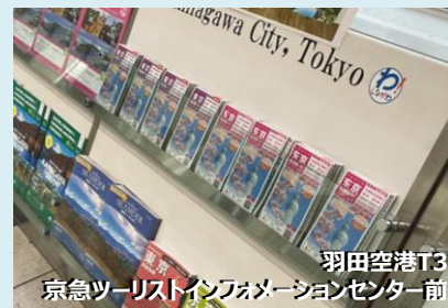
羽田空港T3 京急ツーリストインフォメーションセンター前