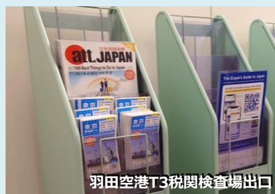
羽田空港T3税関検査場出口