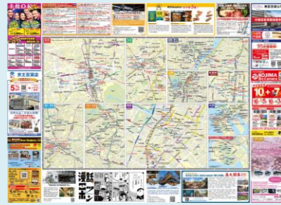
< 誌面 中面 >