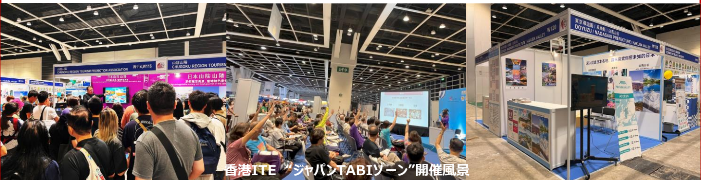
香港ITE “ジャパンTABIゾーン”開催風景

※事前の出展意思表示フォームのご提出により、確保すべき小間数を主催者と共有します。事前意思表示が無くとも、小間が有ればお申込は可能ですが、確実なブース小間が確保出来なかったり、ブース位置が離れてしまう可能性がありますので、出展事前意思表示フォームのご提出にご協力下さい。