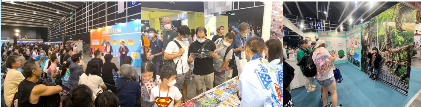
「香港ブックフェア 香港スポーツ&レジャーエキスポ」開催風景

※ 2025年1月10日(金)以降にお申込みの場合でも小間に空きがあればお申込み頂けますが、 確実に出展頂くには調整が必要となります。